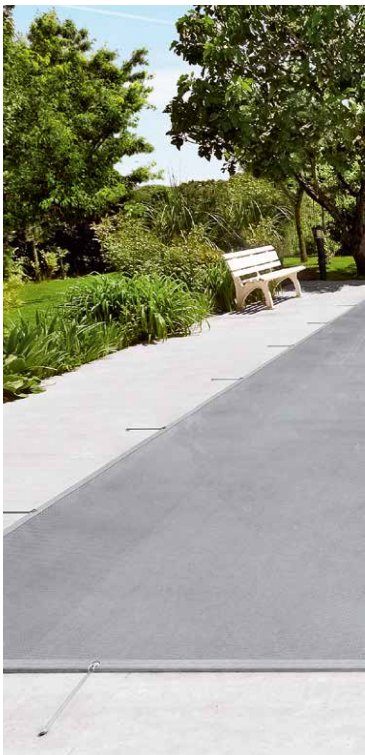
Herausgeberin: Bieri Tenta AG, Schweiz Bild Umschlag: Bieri Schutznetz standard

Ihr Händler vor Ort: Votre distributeur: