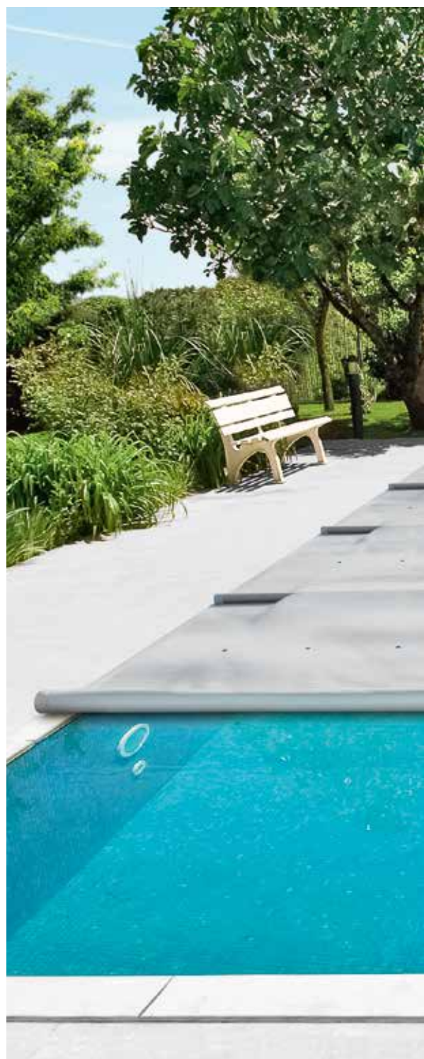
Herausgeberin: Bieri Tenta AG, Schweiz Bild Umschlag: Bieri Rollschutz Simplex

Protection contre le vent pour une bonne protection contre les vents très forts et pour renforcer l'ancrage, les côtés longitudinaux peuvent être équipés d'œilletons au niveau des ourlets. Les œilletons sont alors posés entre les tubes et attachés par des cordons en caoutchouc sur les pitons douilles escamotables. Cette opération est effectuée en usine et il n'est pas possible de le faire ultérieurement.