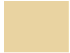
20002 / 1900 Top | Panama