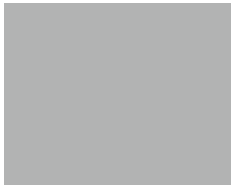
815 / RAL 7038 Top | Panama