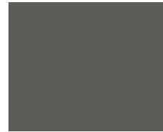
7332 Top | Panama