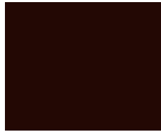
747 / RAL 8017 Top