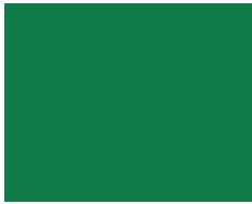
682 / 663 / RAL 6001 Top | Panama