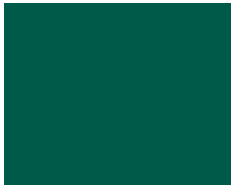
646 / RAL 6026 Top | Panama

Achtung: Diese Farben sind nicht verbindlich und können von jenen auf der Originalkarte stark abweichen! Attention : Ces couleurs ne sont pas liants et peuvent diverger de celles présentée sur la carte originale!